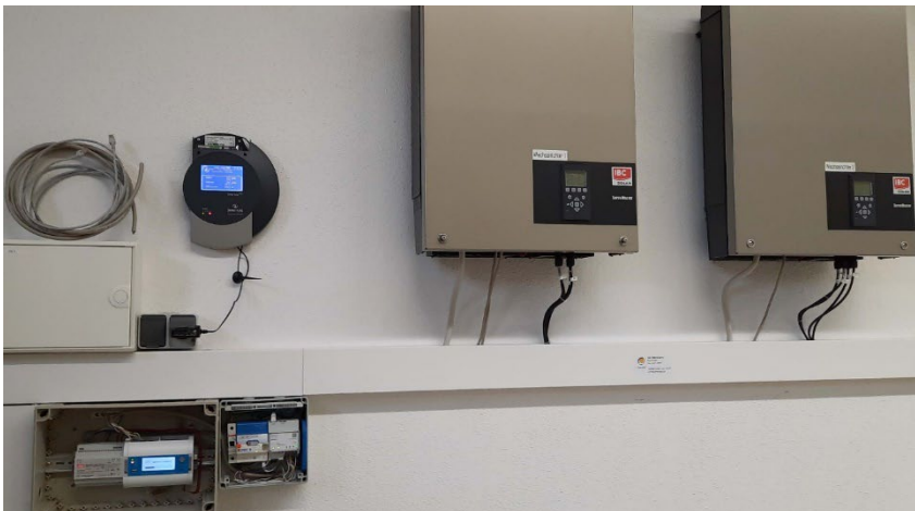
Abbildung 3: Aufbau mit der Swistec-Steuerbox im Umspannwerk Farnroda