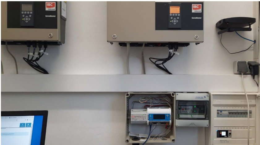
Abbildung 2: Aufbau mit der Prolan-Steuerbox im Umspannwerk Leinefelde